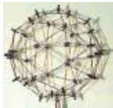
Abb.: Im Projekt entstandener Prototyp eines 32-Kanal Arrays für Innenmessungen

Mit der Einführung computergestützter Methoden zur interferenziellen Rekonstruktion durch erfolgreiche Experimente mit der sog. ‚Akustischen Kamera‘ kamen aus Automobilbau und Bauwesen Anfragen zur Einsetzbarkeit dieser Technik für die Kartierung von Innenräumen. Insbesondere interessieren Schallbrücken in KFZ und in Wohnungsbauten. Gegenstand des Projekts IMF war die Aufnahme des Schallfeldes mittels sphärischem Mikrofonarray und dessen Rekonstruktion auf Flächen einer 3D-Datenbasis (Autocad, VRML).