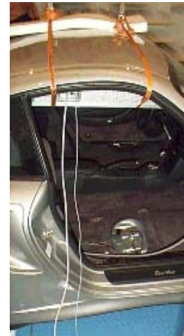
Abb.: Akustische Kamera AC-R16 bei Innenmessungen im Dach eines Porsche 911 turbo